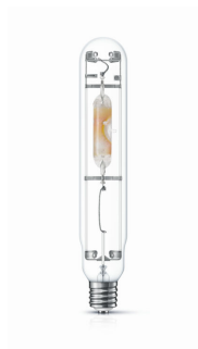
HPI-T 1000W E40